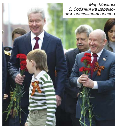
Мэр Москвы С. Собянин на церемонии возложения венков

Кульминацией патриотической акции стала торжественная церемония возложения венков. Почетные гости, ветераны, молодежь Центрального округа почтили память павших минутой молчания и возложили цветы к памятнику Солдата-победителя.